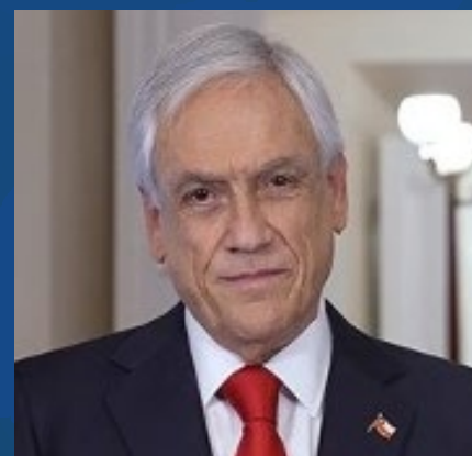
Sebastián Piñera Expresidente de Chile (2010-2014 / 2018-2022)