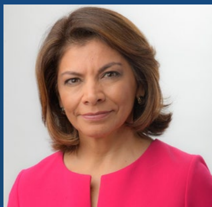
Laura Chinchilla Expresidenta de Costa Rica (2010-2014)