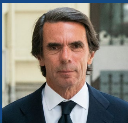
José María Aznar Expresidente del gobierno de España (1996-2004)

Con la participación de los expresidentes: